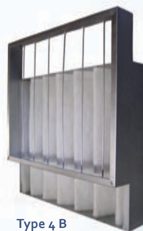
Type 4 B

Cadre et contre cadre en tôle galvanisée rigide avec fils de maintien en acier galvanisé destiné à recevoir un média. Remplacement du média très facile (voir film) sans outil : rouleaux de média à découper par vos soins ou achats de découpes (dimensions du cadre à préciser) . Formule très économique dans le temps.