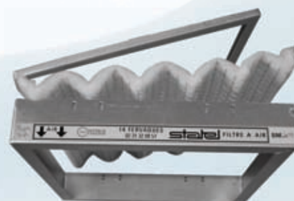
Type 7 B

Cadre en tôle galvanisée ou inox destiné à recevoir un média plissé cousu sur grillage rigide pour maintien des plis. Fermeture par un contre cadre.